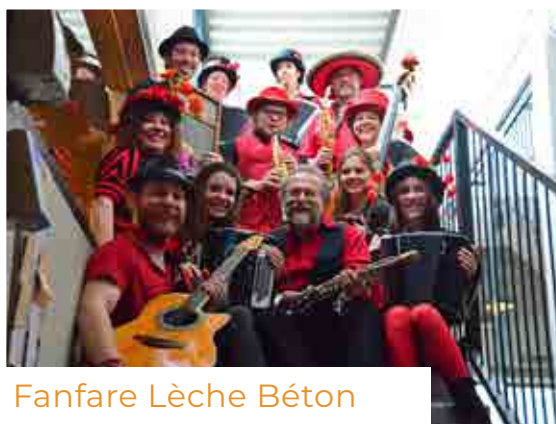
Fanfare Lèche Béton